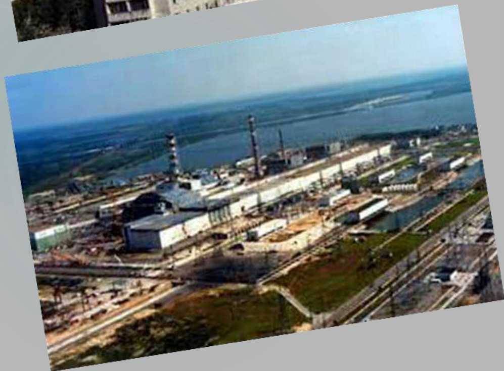
Чорнобильська АЕС до аварії