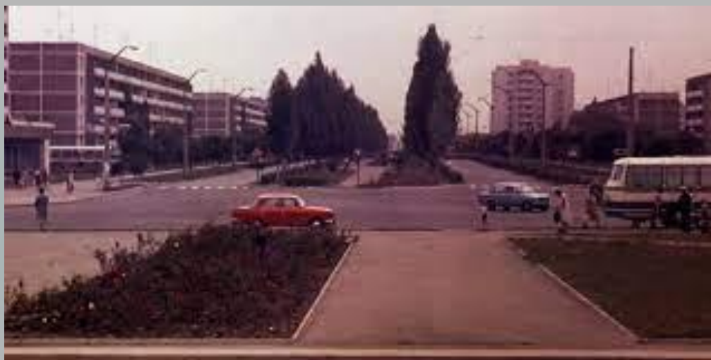
Фото міста Прип'ять до аварії...

Сам Чорнобиль розташований на відстані орієнтовно 12 км від станції АЕС з місцевим населенням в кількості майже 14 тисяч осіб. До аварії АЕС це місто не мало безпосереднього відношення. Станцію назвали Чорнобильською тому, що розташувалася вона в Чорнобильському районі.