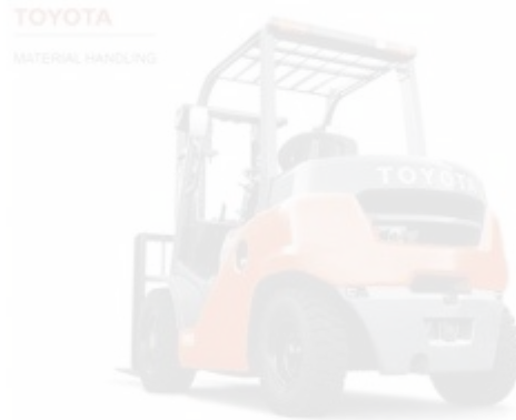
Рисунок 1.11 – Навантажувача Toyota вантажопідйомністю до 3,5 тонн

Розраховуємо нормативний час простою автомобіля під навантажувально-розвантажувальним роботами [5].