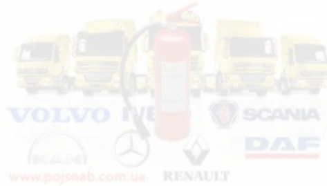
Рисунок 4.1 – Вогнегасник для вантажного автотранспорту

порошкові вогнегасники. Обов'язкова вимога – конструкція вогнегасників повинна витримувати вібрацію (відмітка про відповідні випробування повинна міститися в паспорті вогнегасника).