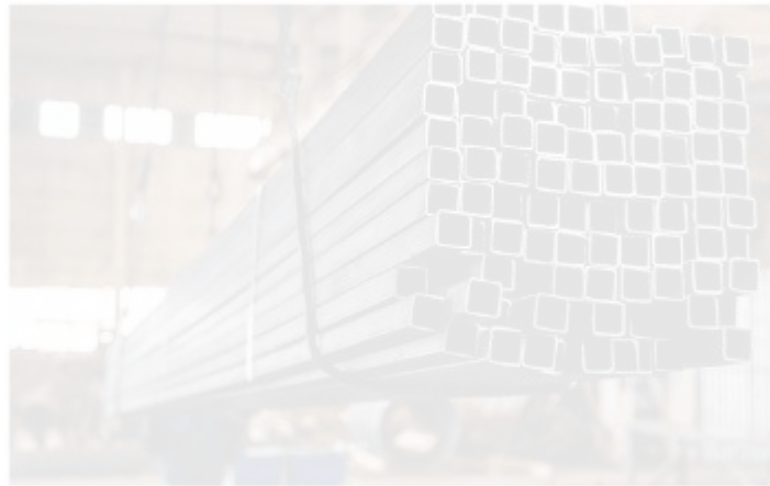
Рисунок 1.2 – Труби електрозварні прямошовні (квадратні)

Труби електрозварні прямошовні (рис.1.2).