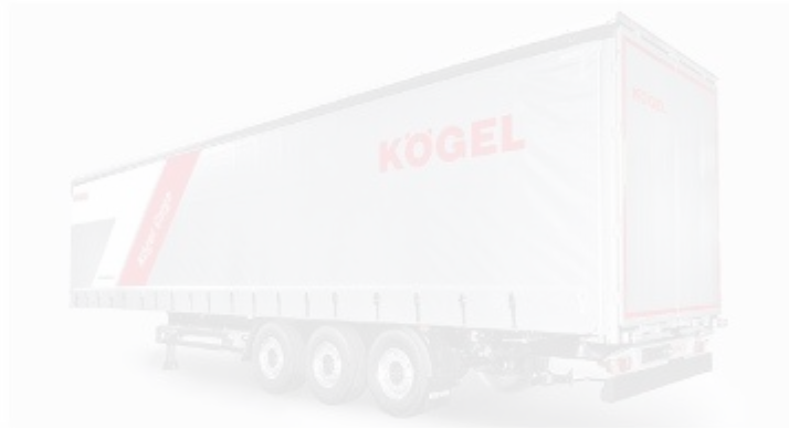
Рисунок 1.10 – Загальний вид напівпричепа фірми Kogel

Починаючи з 2013 року, встановлюваний мотор відповідає нормам Євро-6. Максимальна швидкість моделі дорівнює 85 км/год.