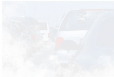
Рисунок 4.2 – Забруднення атмосферного повітря автомобільним транспортом

Обидва ці фактори впливають на забруднення атмосфери як безпосередньо (наприклад, через неефективне спалювання палива), так і побічно (наприклад, через невиправдано високу витрату палива).