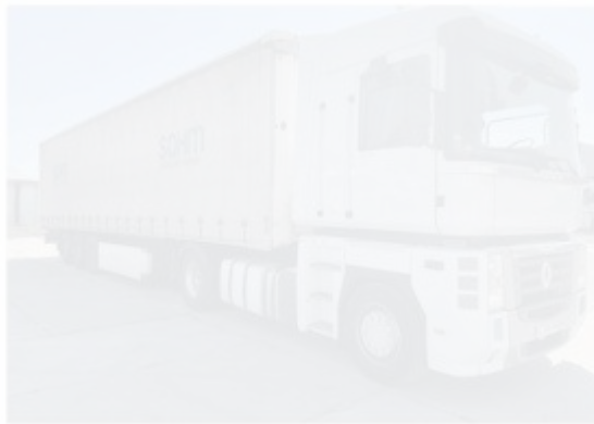
Рисунок 1.7 – Загальний вид сідельний тягач Renault Magnum

Автопарк підприємства ПрАТ «ЮЖКОКС» нараховує понад 20 автомобілів Renault Magnum (рис. 1.7), 5 автомобілів Iveco Stralis XP 480 6X2 (рис. 1.8) та 7 автомобілів DAF XF105.510 6X2 (рис. 1.9) з причепами імпортного виробництва вантажопідйомністю 25 тонн. Усі автомобілі підключені до системи супутникового стеження GPS. Як напівпричіп використовується бортовий 3-осний напівпричіп на пневмопідвеске з тентом зрушення фірми Kogel Cargo SN24 P 90-1.110 (рис. 10).