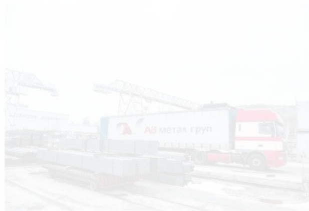
Рисунок 1.4 – Металобаза АВ метал груп

На рисунку 4 показана металобаза АВ метал груп відкілья доставляється металопродукція споживачам.