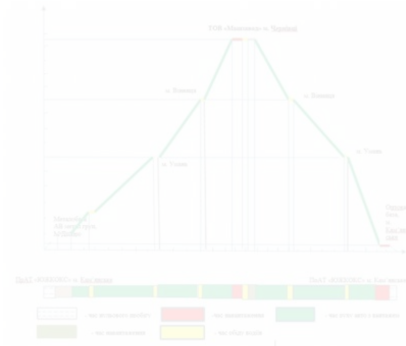
Рисунок 3.1 – Графік руху автомобіля на маршруті 1