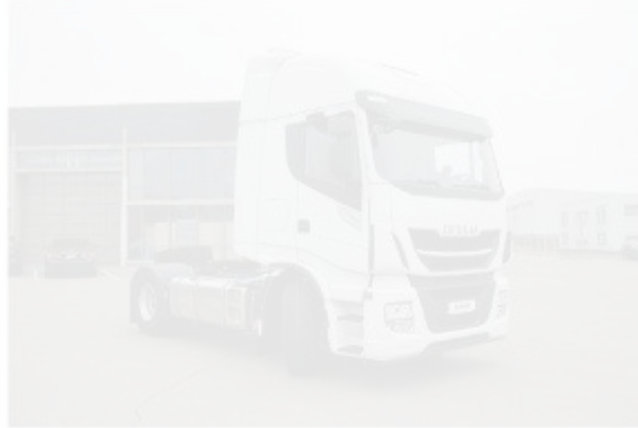
Рисунок 1.8 – Загальний вид сидельний тягач Iveco Stralis

пневматична, с електронним управлінням ECAS. Дискові гальма всіх коліс управляються системою Full EBS з АБС і курсовою стійкістю ESP.