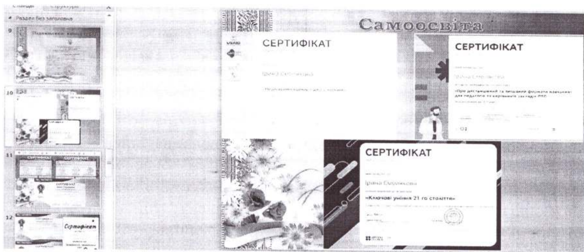
Рис. 2. Фрагмент звіту-презентації за міжатестаційний період завідувачки відділення Ірини СМОЛЯКОВОЇ.

13 педагогічних працівників пройшли чергову атестацію, серед них на посадах викладачів – 8 осіб, 2 – на посадах завідувачів відділення, 1 – як керівник фізичного виховання, 1 – завідувач навчально-виробничою практикою, 1 – завідувач навчально-методичної лабораторії. 2 педагогічним працівникам присвоєно вищу кваліфікаційну категорію, 4 викладачів атестовано на відповідність раніше присвоєній вищій кваліфікаційній категорії, 2 підтверджено вищу кваліфікаційну категорію та педагогічне звання «викладач-методист». Процедура підсумкового засідання атестаційної комісії проходила як звіт-презентація роботи педагогічного працівника за міжатестаційний період (рис.2).